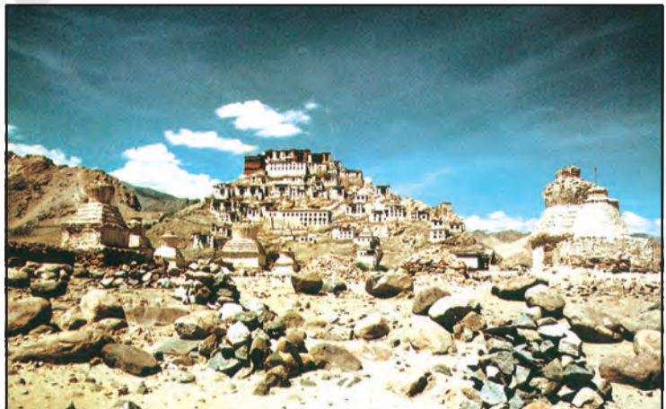
चित्र 7.5 : थिकसे मठ

ग्रीष्म ऋतु में यहाँ के निवासी जौ, आलू, मटर, सेम एवं शलजम की खेती करते हैं। शीत ऋतु में जलवायु इतनी कष्टकारी होती है कि लोग धार्मिक अनुष्ठानों एवं उत्सवों में अपने आपको व्यस्त रखते हैं। यहाँ की महिलाएँ अत्यधिक परिश्रमी होती हैं। वे केवल घर एवं खेतों में ही काम नहीं करती बल्कि छोटे व्यवसाय एवं दुकानें भी संभालती हैं। लद्दाख की राजधानी लेह, सड़क एवं वायुमार्ग द्वारा भलीभाँति जुड़ी हुई है। राष्ट्रीय राजमार्ग-1ए लेह को जोजीला दर्रा होते हुए कश्मीर घाटी से जोड़ता है। क्या आप हिमालय के कुछ अन्य दर्रा के बारे में बता सकते हैं?