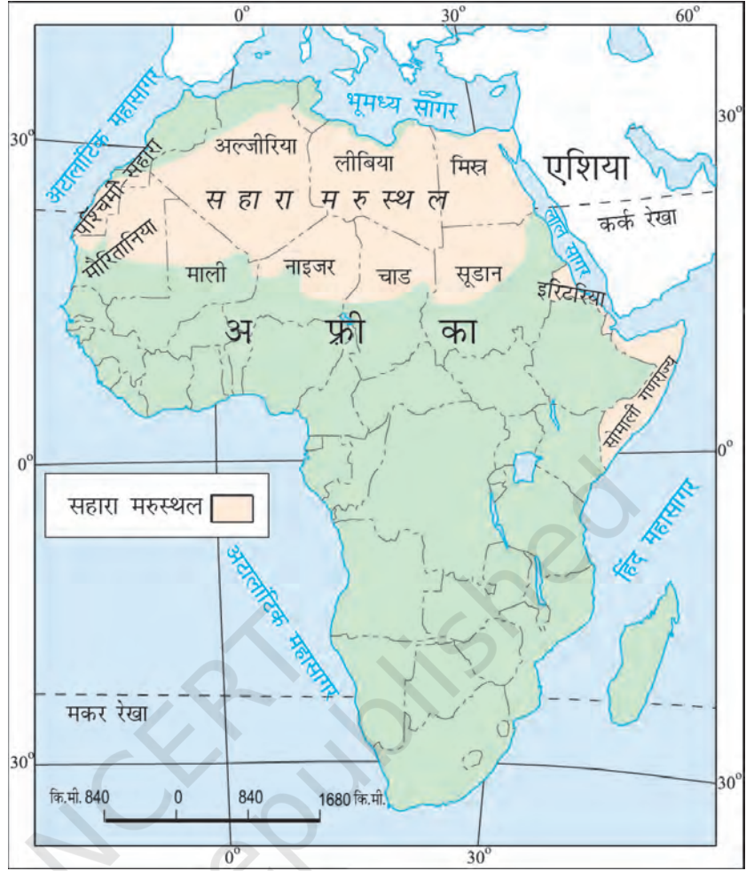
चित्र 7.2 : अफ्रीका महाद्वीप में सहारा

आपको यह जानकर आश्चर्य होगा कि आज का सहारा रेगिस्तान एक समय में पूर्णतया हरा-भरा मैदान था। सहारा की गुफाओं से प्राप्त चित्रों से ज्ञात होता है कि यहाँ नदियाँ तथा मगर पाए जाते थे। हाथी, शेर, जिराफ़, शतुरमुर्ग, भेड़, पशु तथा बकरियाँ सामान्य जानवर थे। परंतु यहाँ के जलवायु परिवर्तन ने इसे बहुत गर्म व शुष्क प्रदेश में बदल दिया है।