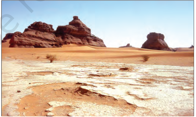
चित्र 7.1 : सहारा रेगिस्तान

विश्व एवं अफ्रीका महाद्वीप के मानचित्र को देखिए। उत्तरी अफ्रीका के बड़े भू-भाग पर फैले सहारा के रेगिस्तान का पता लगाएँ। यह विश्व का सबसे बड़ा रेगिस्तान है। यह लगभग 8.54 लाख वर्ग किलोमीटर के क्षेत्र में फैला हुआ है। क्या आपको याद है कि भारत का क्षेत्रफल 32.8 लाख वर्ग किलोमीटर है? सहारा रेगिस्तान ग्यारह देशों से घिरा हुआ है। ये देश हैं-अल्जीरिया, चाड, मिस्र, लीबिया, माली, मौरितानिया, मोरक्को, नाइजर, सूडान, ट्यूनिशिया एवं पश्चिमी सहारा।