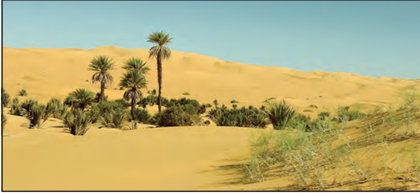
चित्र 7.3 : सहारा रेगिस्तान में मरूद्यान

ऊँट, लकड़बग्घा, सियार, लोमड़ी, बिच्छू, साँपों की विभिन्न जातियाँ एवं छिपकलियाँ यहाँ के प्रमुख जीव-जंतु हैं।